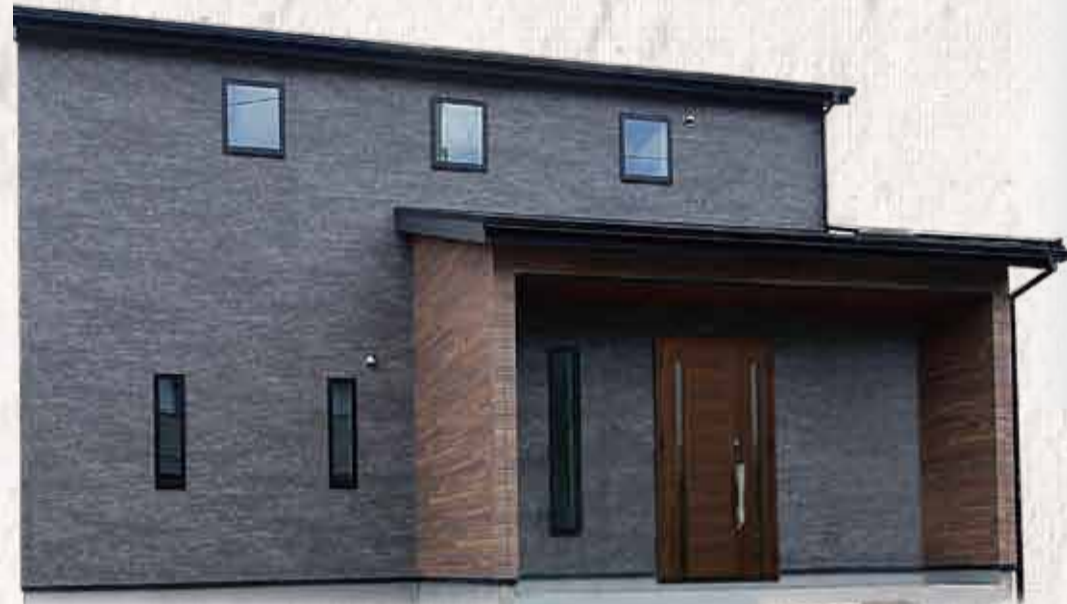
現地コンセプトハウス