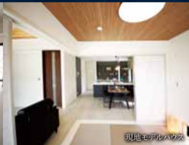
現地モデルハウス